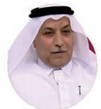
الدكتور علي أحمد الكبيسي

كاتب وأكاديمي، عضو المجلس العلمي لمعجم الدوحة التاريخي للغة العربية