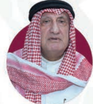
الدكتور حسن علي النعمة

شاعر وكاتب، رئيس مجلس أمناء جائزة الشيخ حمد للترجمة والتفاهم الدولي