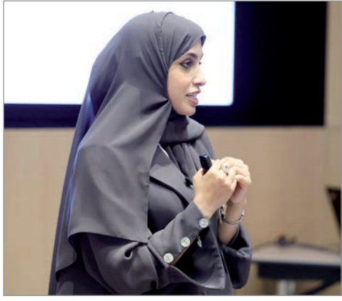
إحدى الفتيات تتحدث بالبرنامج

واكد البيان أنه «في هذه النسخة تم التعاون مع السفارة البريطانية واليونيسكو كشريكين دوليين لإثراء الجانب الدولي والتعاون وتمكين المنتسبين محليا ودوليا. وستلقى المنتسبون تدريبات في الاعلام والسياسة العامة وكتابة السياسات والتقارير الدولية والبروتوكول الدولي وفن المناظرات والبيئة والمناخ وغيرها من التدريبات النوعية التي ستقدم من قبل شركائنا المتعددين. وفي هذه النسخة سيتم طرح عدة إنجازات على المنتسبين منها تصدير برنامج سفراء شباب لدعم نسبة للنجاح الذي توج فيه البرنامج محليا والمخرجات وطريقة التدريب النوعية فقد تم تطوير فكرة مشابهة في سلطنة عمان ومملكة البحرين ويفتخر العاملون بالبرنامج على تطوير نموذج استثنائي للشباب القطري يتم تصديره دوليا حيث يعتبر انجاز يفخر به.