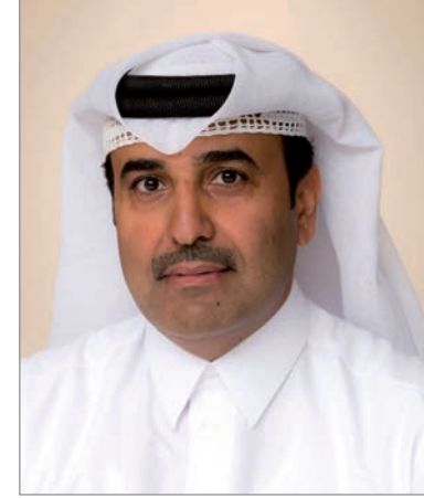
■ عيسى بن محمد المهدي