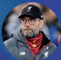
يورجن كلوب المدير الفني للريدز

مدير ألماني درب ماينتس وبوروسيا دورتموند وفي عام 2015، تم تعيينه لتدريب ليفربول، قادهم في أول موسم له إلى نهائيات كأس الرابطة ونهائي الدوري الأوروبي وفي 2019 فاز بدوري أبطال أوروبا ضد توتنهام وفي 2021 حقق لقب الدوري الإنجليزي بعد 30 عاماً غاب فيها عن ليفربول.