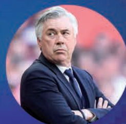
كارلو أنشيلوتي المدير الفني للملكي

هو مدرب كرة قدم إيطالي محترف وهو واحد من ثلاثة مدربين فقط فازوا بدوري أبطال أوروبا ثلاث مرات (مرتين مع ميلان ومرة مع ريال مدريد)، وواحد من اثنين فقط درب في أربعة نهائيات. فاز بكأس العالم للأندية مرتين ويُعتبر من أفضل وأجح المدربين في التاريخ.