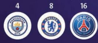
باريس سان جيرمان تشيلسي مانشستر سيتي