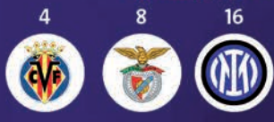
اترميلان بنفيكا فيا ريال