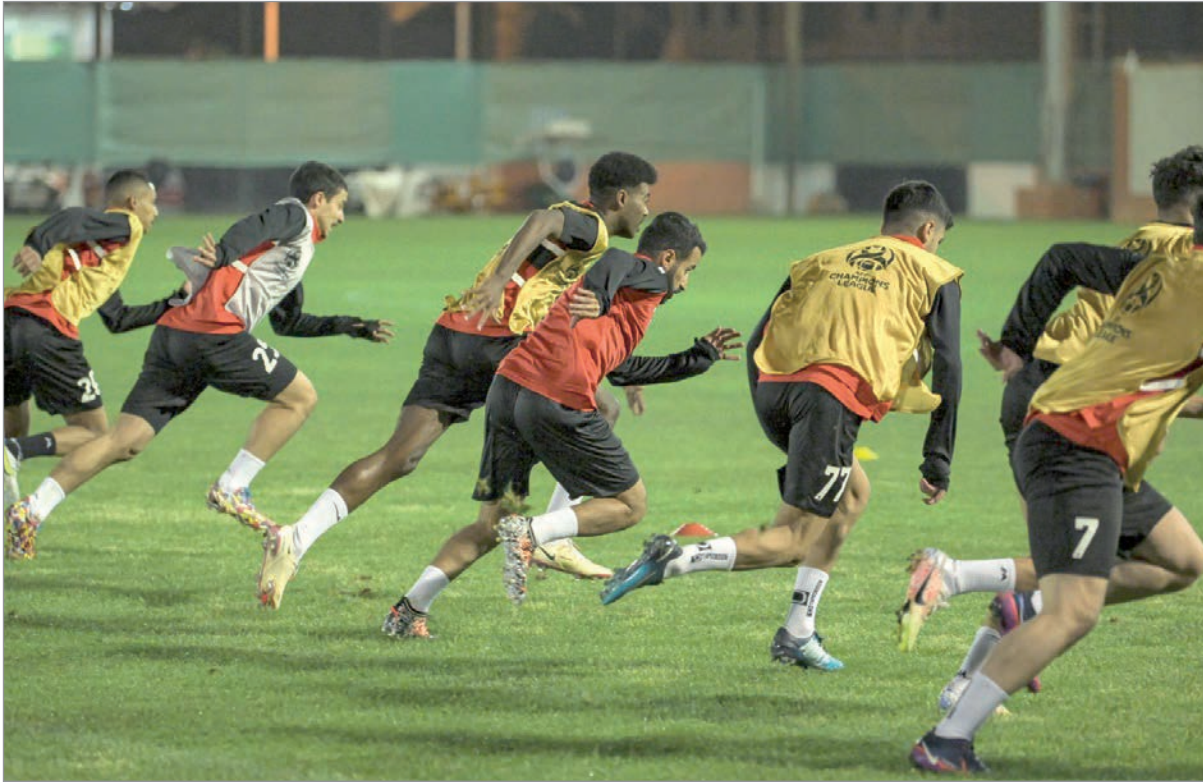
■ جانب من تدريبات الريان