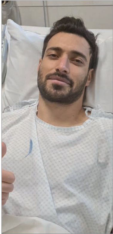
■ اللاعب الإيراني شجاع