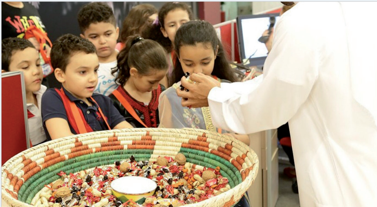
«القرنقعو».. تقليد رمضاني يثير بهجة أطفال قطر

رمضان هذا العام له معنى خاص، حيث نحتفل به ونحن نعاني من الصعوبات غير المسبوقة التي يسببها الوباء. تعاونت قطر وكوريا بشكل وثيق على المستويين الثنائي والدولي في التعامل مع وباء «كوفيد-19». مع كوريا والدول ذات التفكير المماثل، أطلقت قطر «مجموعة الأمم المتحدة لأصدقاء التضامن من أجل الأمن الصحي العالمي» في سبتمبر الماضي للتغلب على هذه الأزمة. نتشارك في التضامن والحاجة الملحة للتعاون، ناهيك عن التعاطف مع أولئك الذين يعانون.