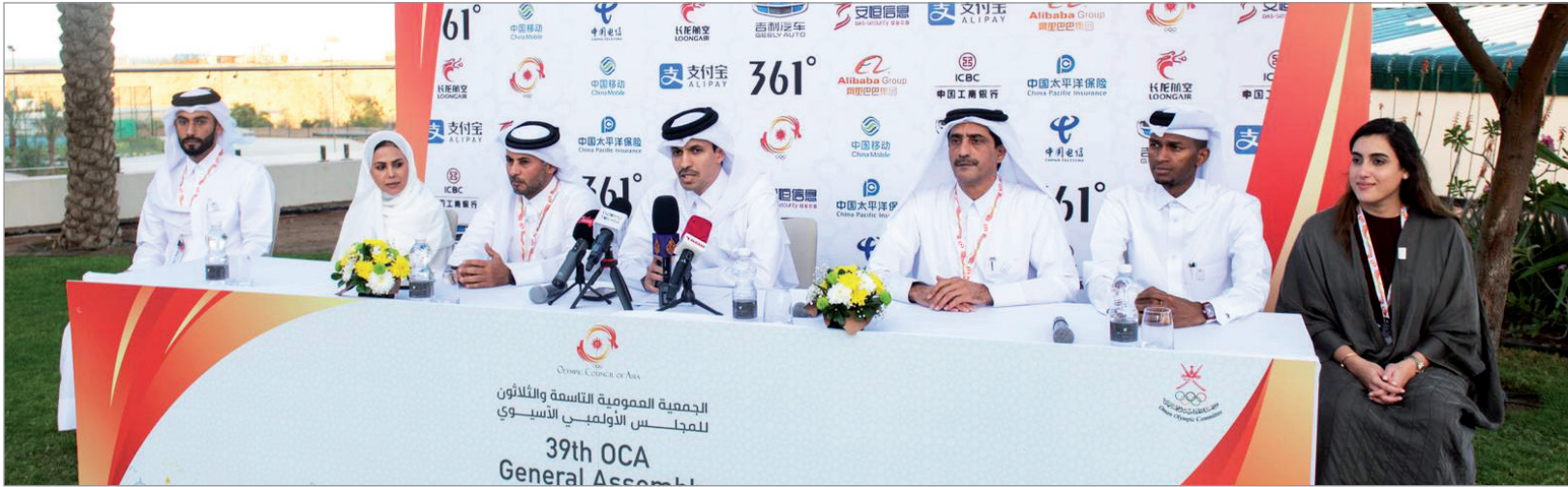
■ المؤتمر الصحفي

الدبلوماسية الرياضية القطرية أكدت علو كعبها في هذا المجال وفخورون بالفوز بالتنظيم