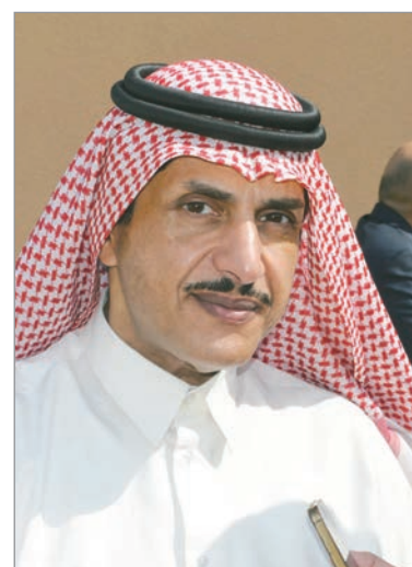
■ فهد بن علي آل ثاني