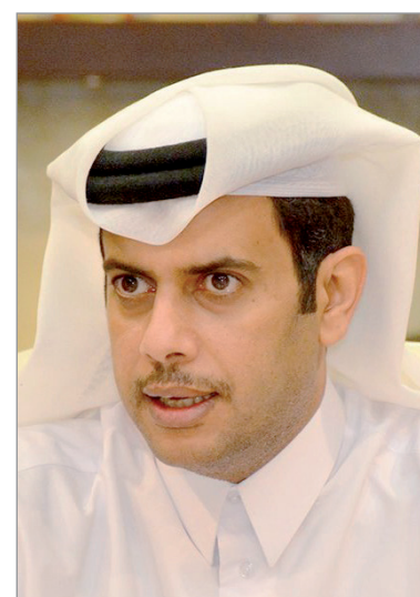
■ حمد بن عبد الرحمن العطية

أعرب حمد بن عبد الرحمن العطية رئيس الاتحادين القطري والآسيوي للفروسية عن افتخاره من كل قلبه بنجاح الدوحة بشرف تنظيم «أكبر حدث رياضي في القارة الآسيوية عام 2030» للمرة الثانية بعد 2006 حيث حظى ملف الدوحة 2030 بالدعم الكامل من حضرة صاحب السمو الشيخ تميم بن حمد آل ثاني أمير البلاد المفدى، وهذا الملف يعد ركيزة أساسية من رؤية قطر 2030، لاسيما وان استضافة الحدث تحظى بالأولوية الشعب القطري، حيث ينظر اليه باعتباره مجالا وفرصة وإثباتا أن اللجنة تحقق الأولويات المستدامة، وتعتبر بوابة نحو التميز، خاصة في ظل امتلاك جميع مقومات النجاح من خبرات وتجارب سابقة يشهد لها بالتميز ونال الملف الدعم الحضاري من اللجنة الأولمبية برئاسة سعادة الشيخ جوعان بن حمد آل ثاني وفريق العمل الرائع المثالي. وهذه الدورة ستكون بمثابة بوابة نحو فتح إرث مستقبلي سينطلق من الآن.. ونتطلع إلى بذل كافة الجهود وتوجيهها لخدمة الرياضة.