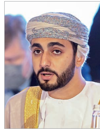
وزير الثقافة العماني

الرياضة والثقافة والرياضة العماني: البطولات الرياضية تساهم في تطور الدول الآسيوية