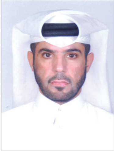
■ علي بن محمد المهدي