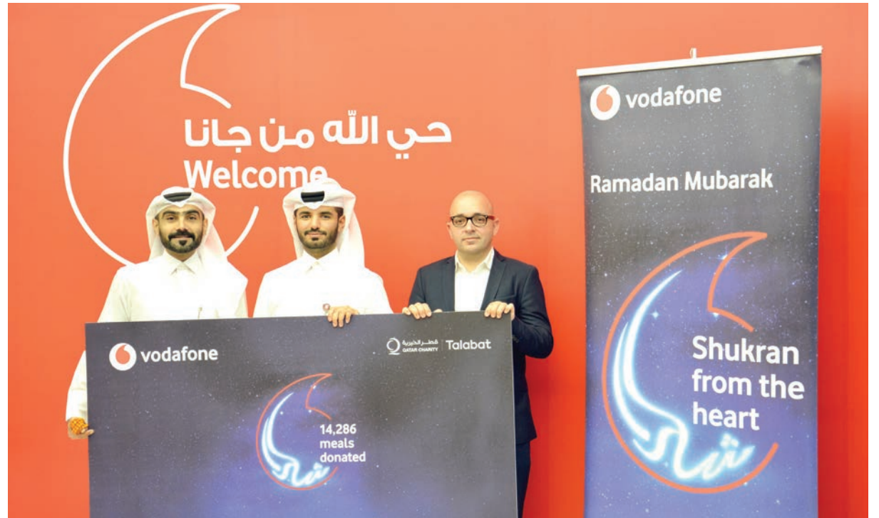
■ مبادرة فودافون بالتعاون مع «طلبات»