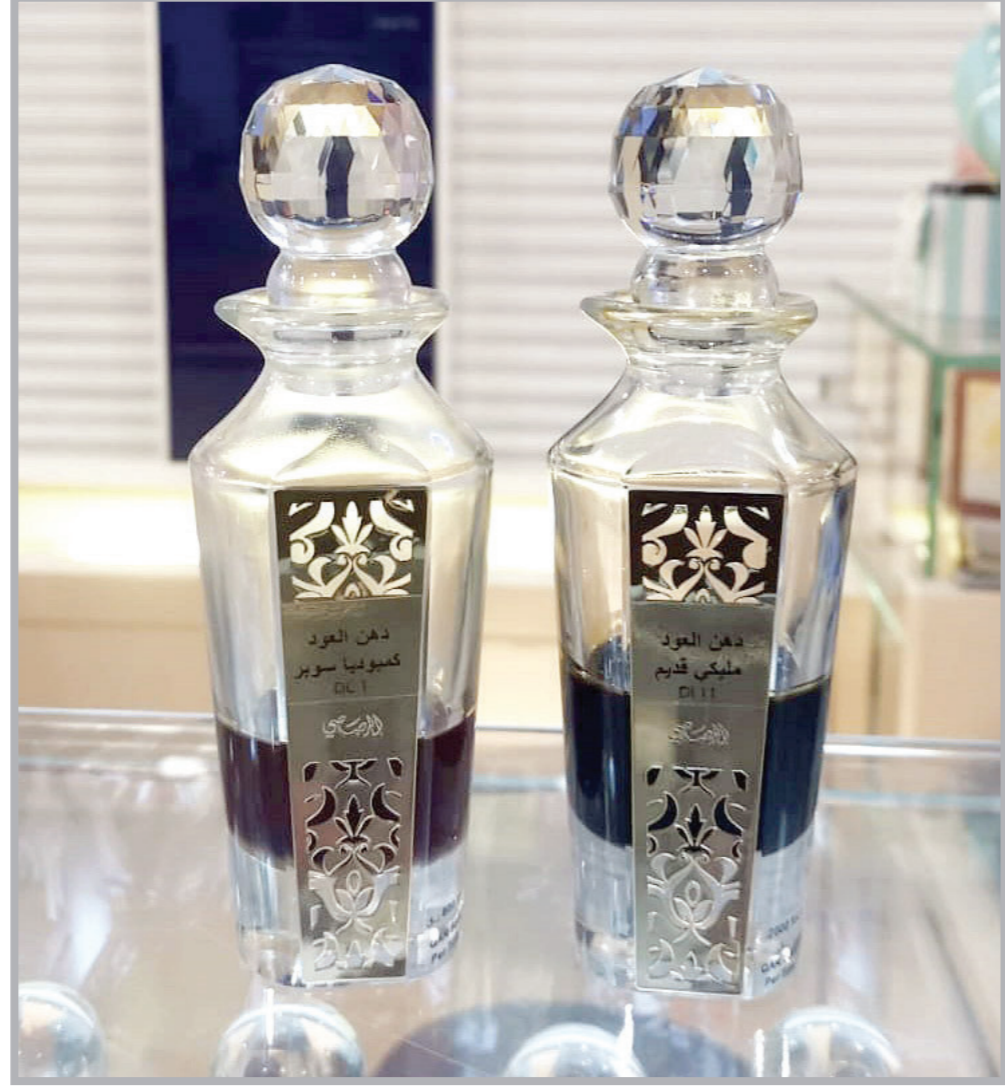
■ منتجات العود ودهن العود والعطور تتناسب جميع الأذواق