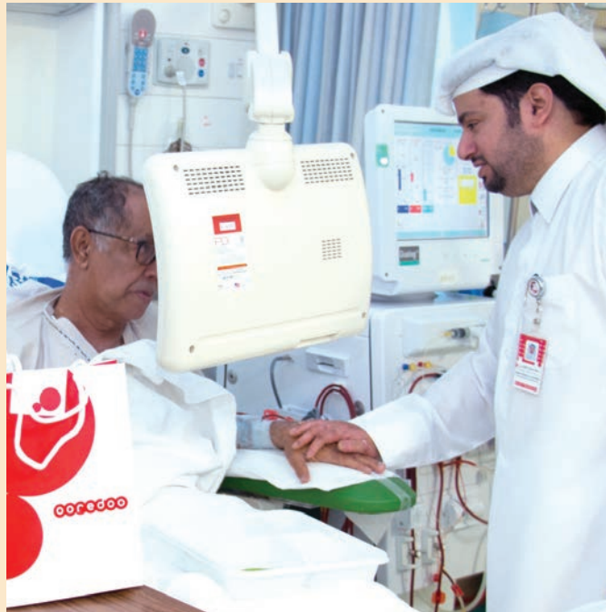
■ جانب من زيارة متطوعي Ooredoo

وتحرص Ooredoo على دعم مرضى الكلى في قطر، إذ ساهمت بإنشاء مركز فهد بن جاسم للكلى وافتتاحه عام 2010 لتوفير خدمات غسيل الكلى للمرضى. ويضم المركز منطقة حديثة وواسعة