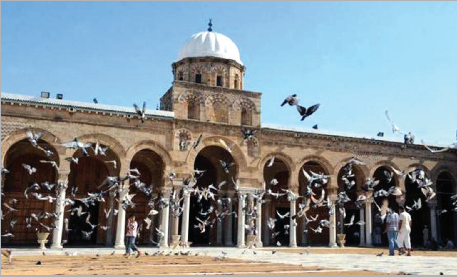
■ جامع الزيتونة