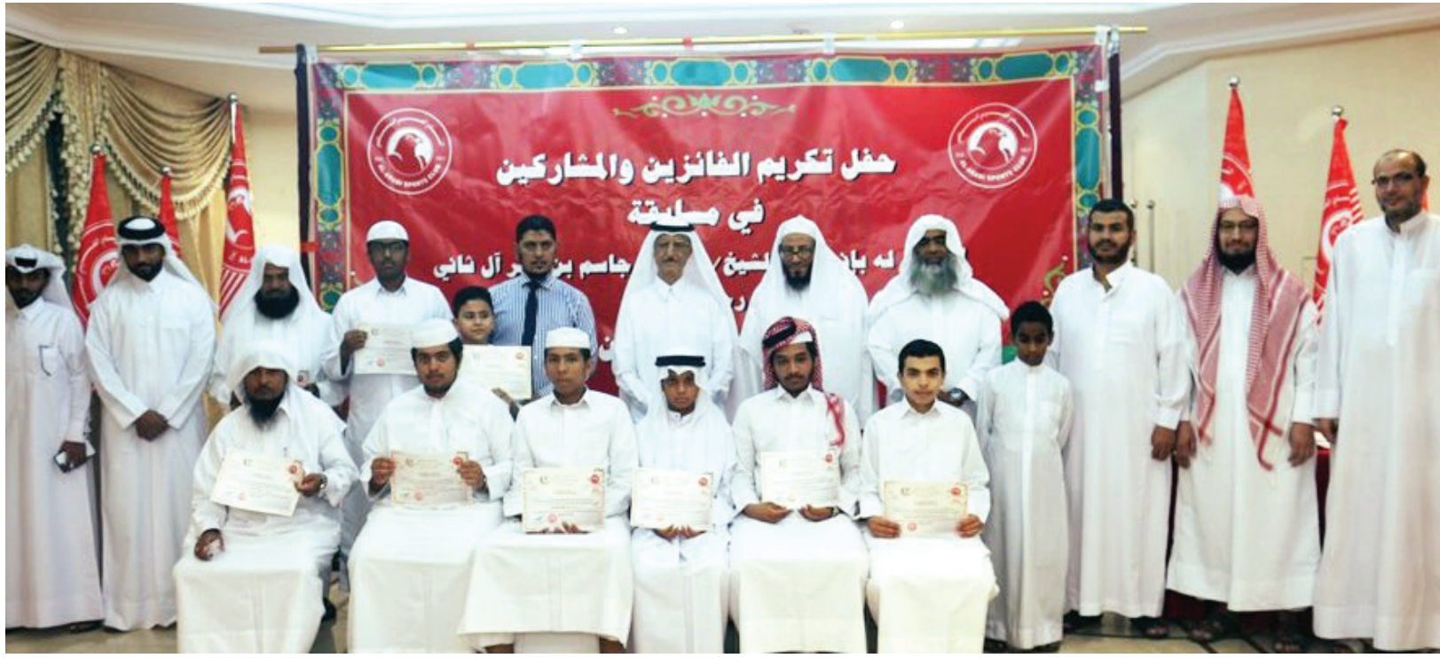
تكريم الفائزين بمسابقة الشيخ فهد بن جاسم