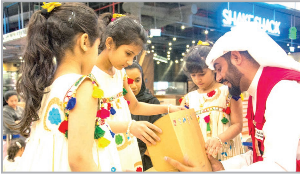
■ جانب من المبادرة

وبلغ إجمالي عدد اللعب التي تبرع بها الأطفال خلال الحملة الأولى التي احتضنها مول دوحة فستيفال سيتي 6,577 لعبة مختلفة الأحجام، وهو ما يعكس نجاح المبادرة في الوصول إلى قلوب الجماهير والتأثير في نفوس الأطفال. وتؤكد علياء المعاضيد أن الحملات القادمة ستشهد بإذن الله تزايد إقبال الأطفال على التبرع باللعب، في ظل انتشار الوعي بين هذه الفئة صغيرة السن بقيمة التبرع ولو بالقليل، حتى ولو بلعبة بسيطة.