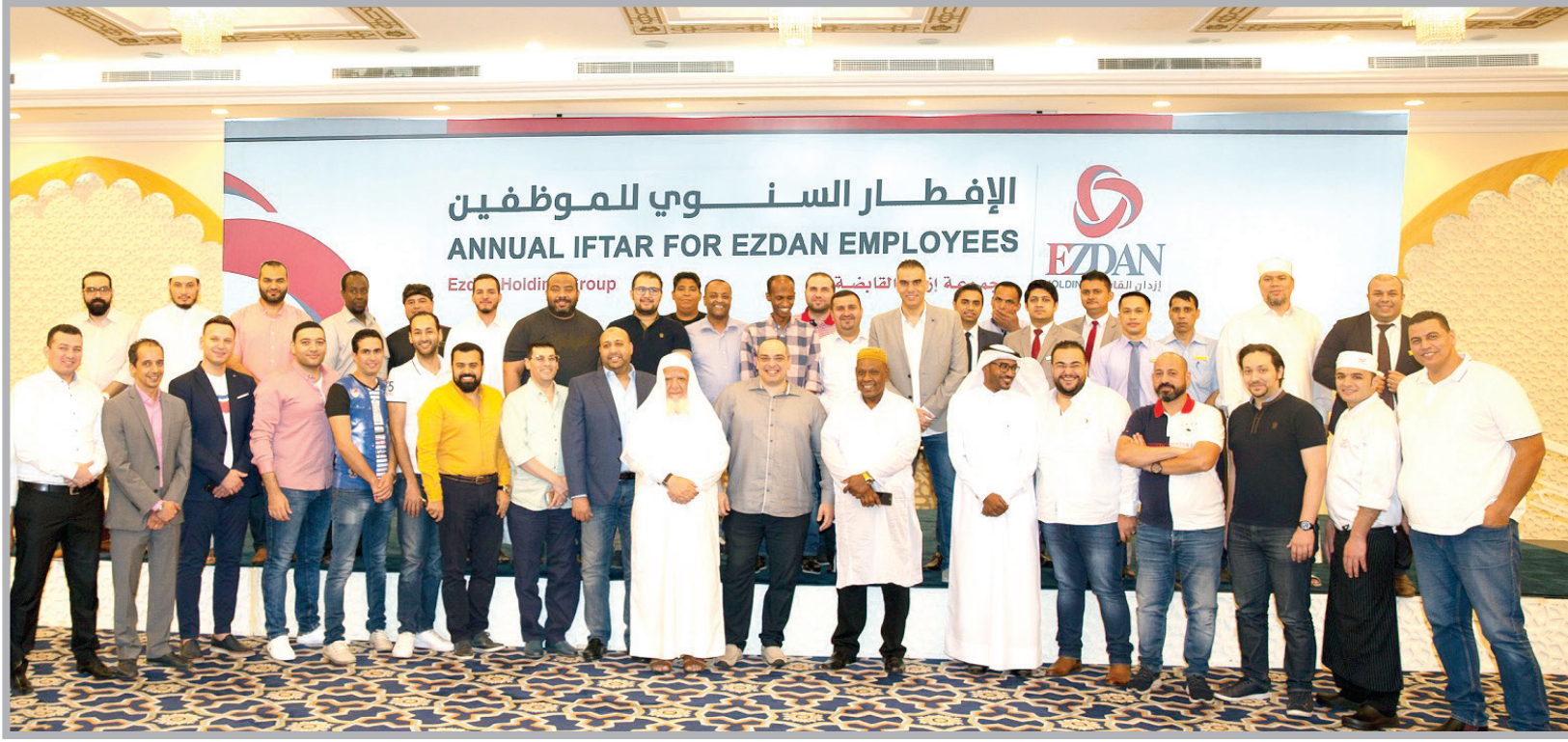
■ جانب من الموظفين المشاركين بحفل الإفطار

تعزيزاً لدورها في المسؤولية الاجتماعية وتشجيعاً