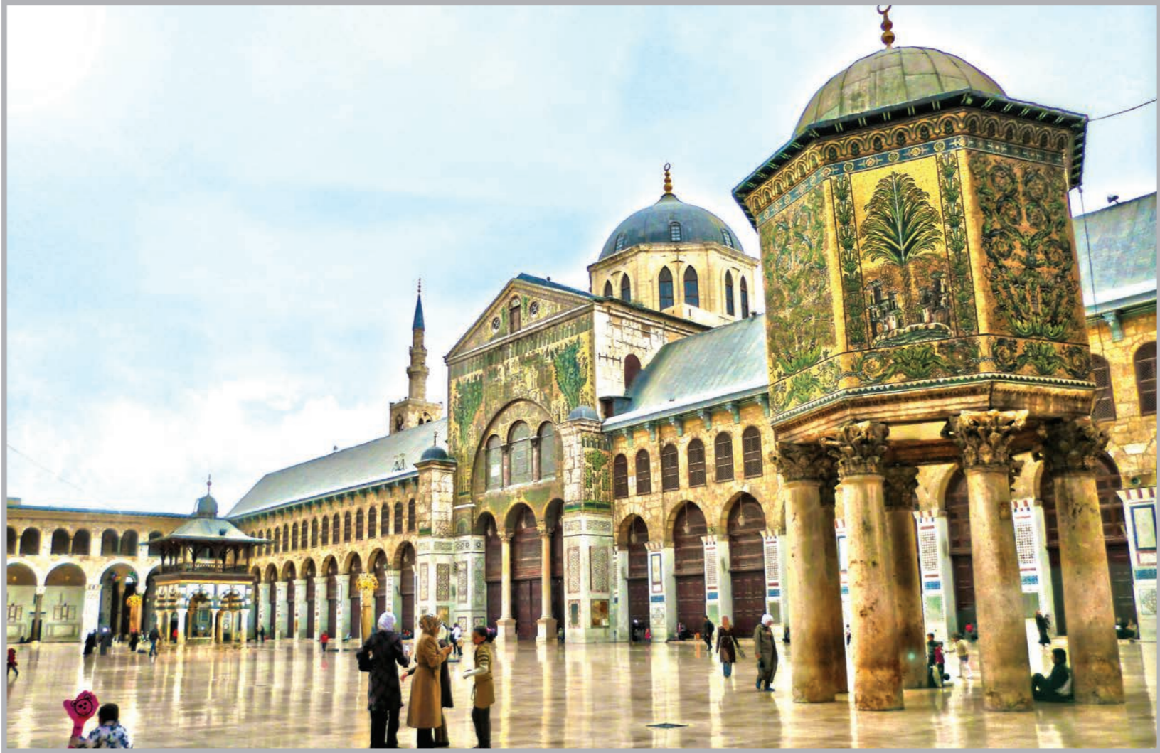
بيت المال الذي أنشأه عمر بن الخطاب

تشابه عهد أبي بكر من الناحية المالية بعهد النبي صلى الله عليه وسلم، فكانت الموارد نفسها: زكاة، غنائم، فيء وجزية، وسار على نهج النبي صلى الله عليه وسلم في سياسته المالية، وأعطى المسلمين عطاءً متساوياً دون أن ينظر إلى النسب أو السبق في الإسلام، وبعدما قدم مال البحرين على أبي بكر (بعد وفاة النبي صلى الله عليه وسلم)، قال: من كان له عند النبي صلى الله عليه وسلم عدة فليأت (أي من كان وعده النبي بشيء من المال فليأت ليستوفي ما وعده النبي صلى الله عليه وسلم)، وكان بهذا يريد الإيفاء بحق النبي صلى الله عليه وسلم والوفاء له ولوعوده بعد موته، فجاءه جابر بن عبد الله فقال: إن رسول الله صلى الله عليه وسلم كان قال: «لو جاء مال البحرين أعطيتك هكذا وهكذا وهكذا»، يعني: ملء كفيه، فلما جاء مال البحرين أمر الصديق جابراً، فغرف بيديه من المال، ثم أمره بعبذه، فإذا هو 500 درهم، فأعطاه مئليها معها.