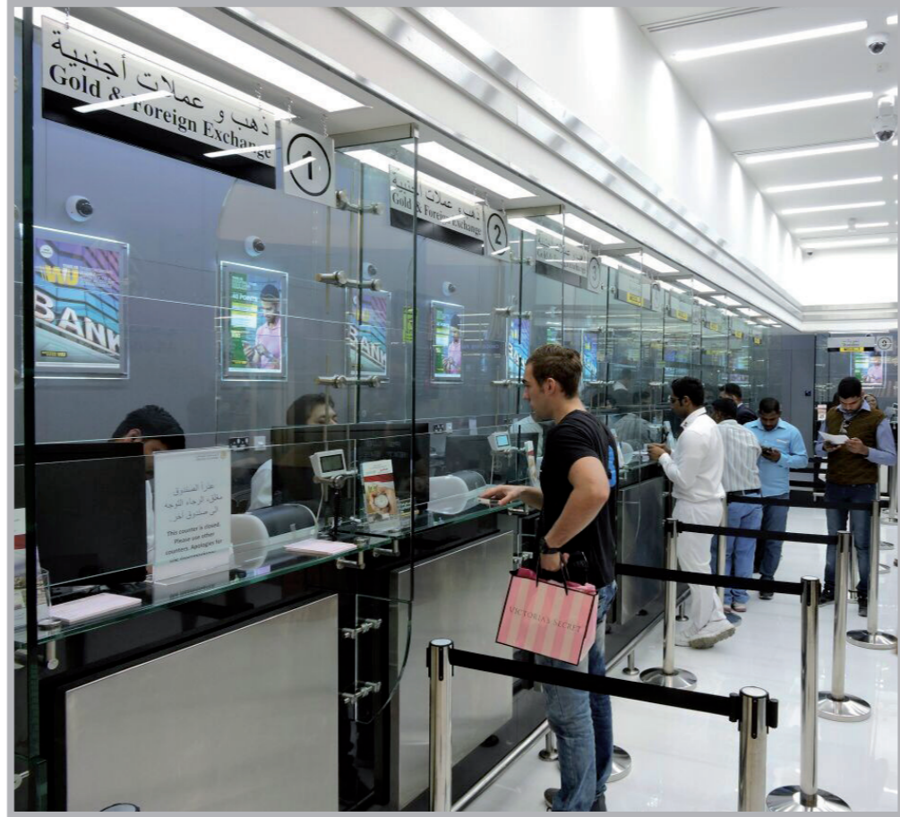
حركة التعاملات المالية تنشط خلال فترة الأعياد