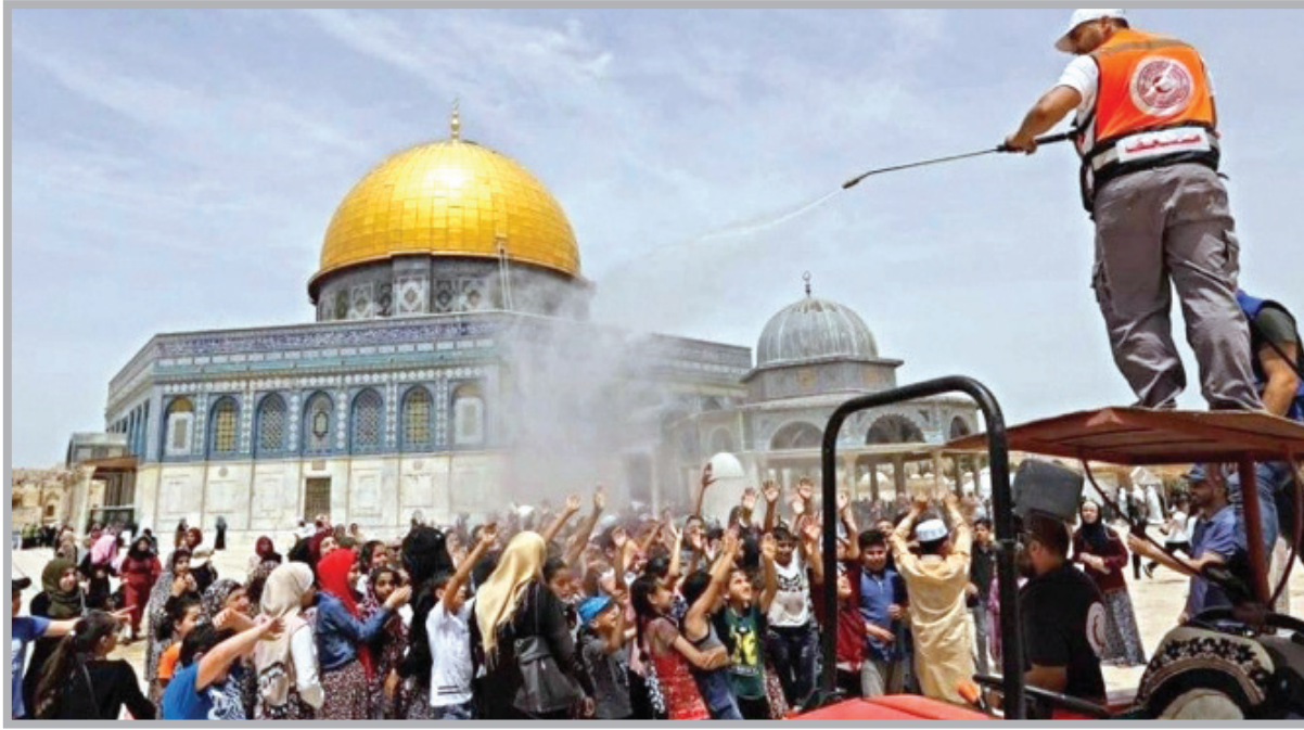
رش الماء لتخفيف وطأة الحر بالأقصى