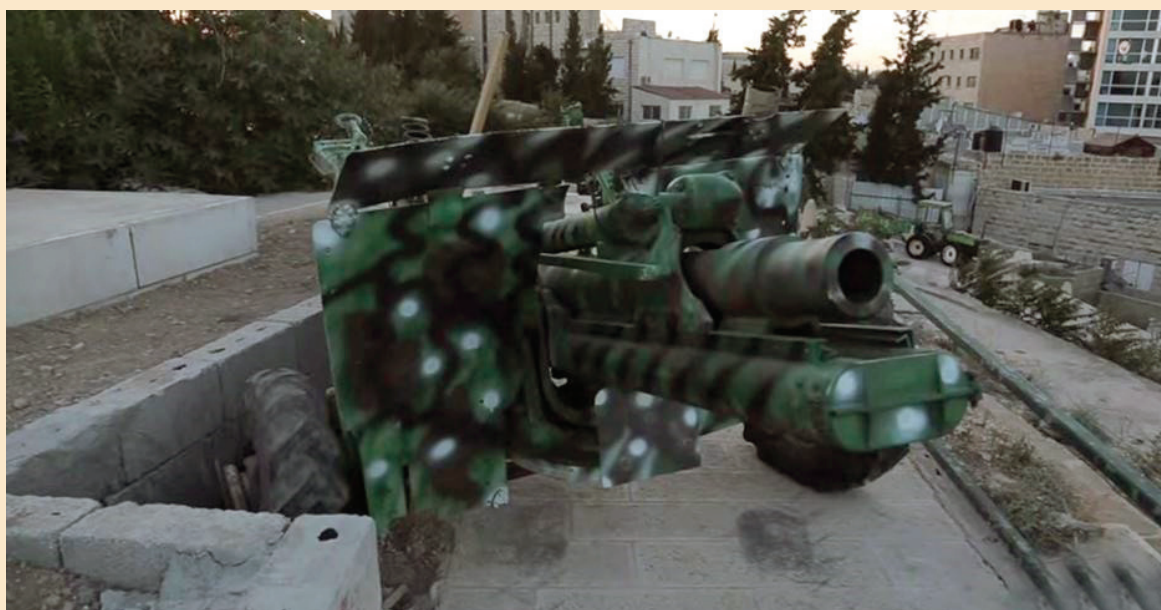
مدفع رمضان في القدس إرث عماني تتوارثه الأجيال

ويبين صندوقة أنه يتعرض إلى الكثير من المنغصات والتدخلات الإسرائيلية في عمله، ولكنه يبقى مصرا على الحفاظ على هذا الإرث القديم، مثل الإصرار الإسرائيلي على وجوب مشاركته في دورة خاصة في استخدام قنابل الصوت، والحصول على إذن خاص لإطلاق المدفع.