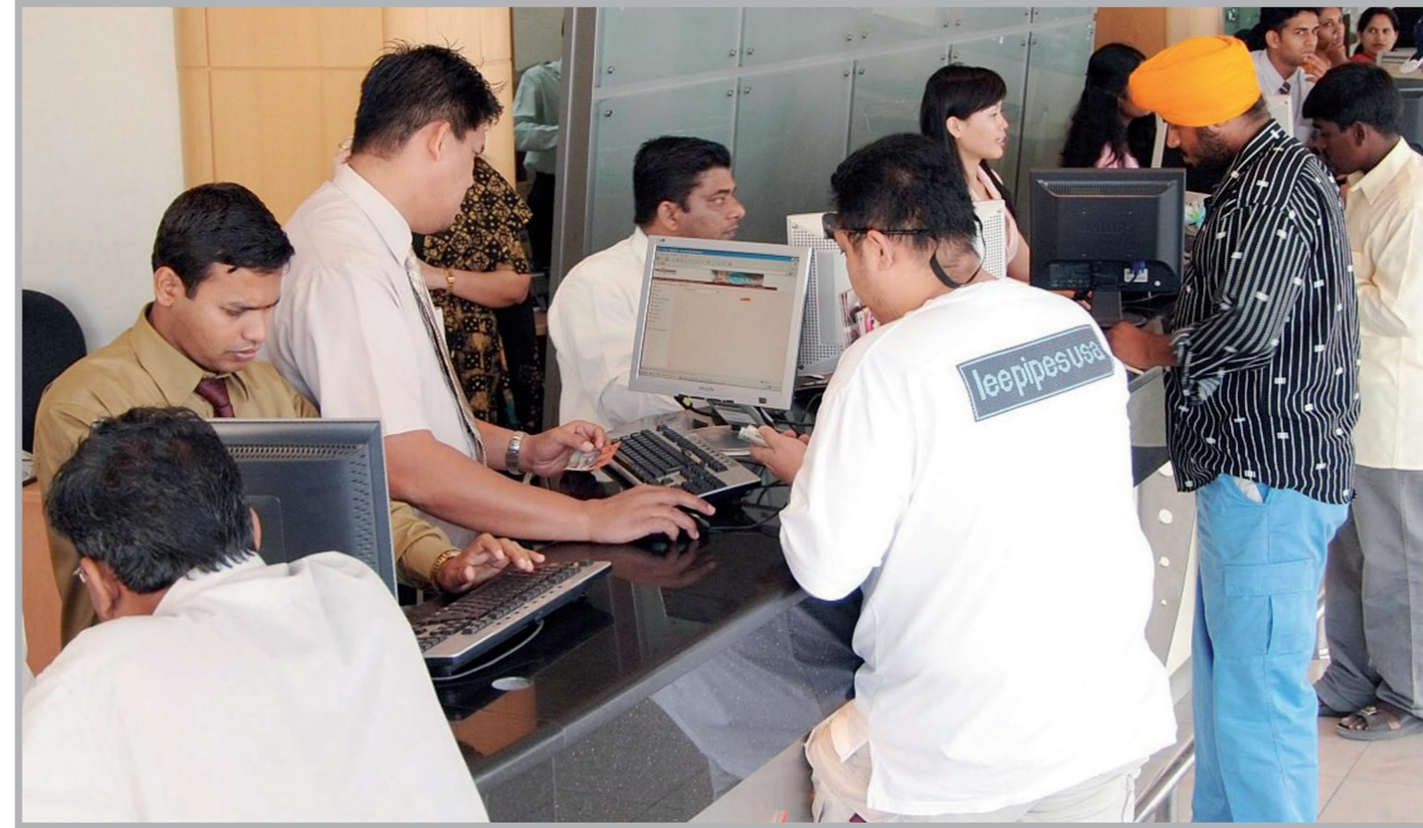
شركة صرافة اقبال كثيف في رمضان والعيد

تتحول شركات الصرافة والفروع التابعة لها إلى جانب محلات الصرافة إلى خلية نحل لا تهدأ مع دخول النصف الثاني من شهر رمضان الكريم، حيث ترتفع وتيرة العمل داخل هذه الشركات والفروع المرخصة من قبل مصرف قطر المركزي للعمل وتقديم الخدمات المالية لفائدة جمهور المتعاملين، حيث علم «مضانيات» أن توجهات الجهات الرقابية والإشرافية على قطاع الصرافة في الدولة أوعزت لكافة الشركات بضرورة اتخاذ كافة التدابير والإجراءات المناسبة واللائمة من أجل حسن تقديم الخدمات وتوفير أفضل التعاملات لفائدة العملاء الذين يرتفع إقبالهم على التحويلات المالية نحو العديد من الدول مع اقتراب نهاية شهر رمضان والبدء بالاستعداد لاستقبال عيد الفطر المبارك.