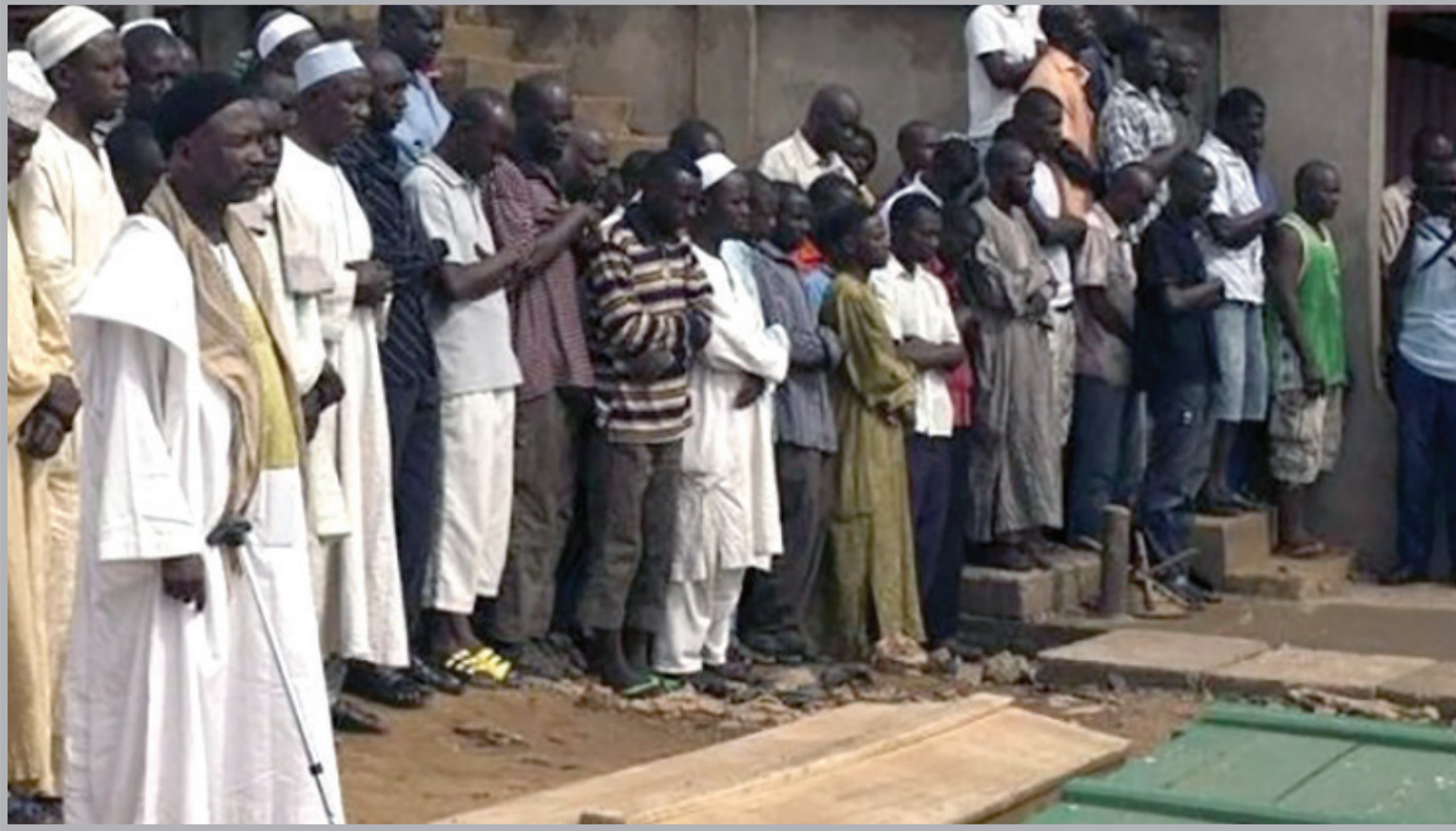
■ مظاهر الشهر الفضيل في ساحل العاج