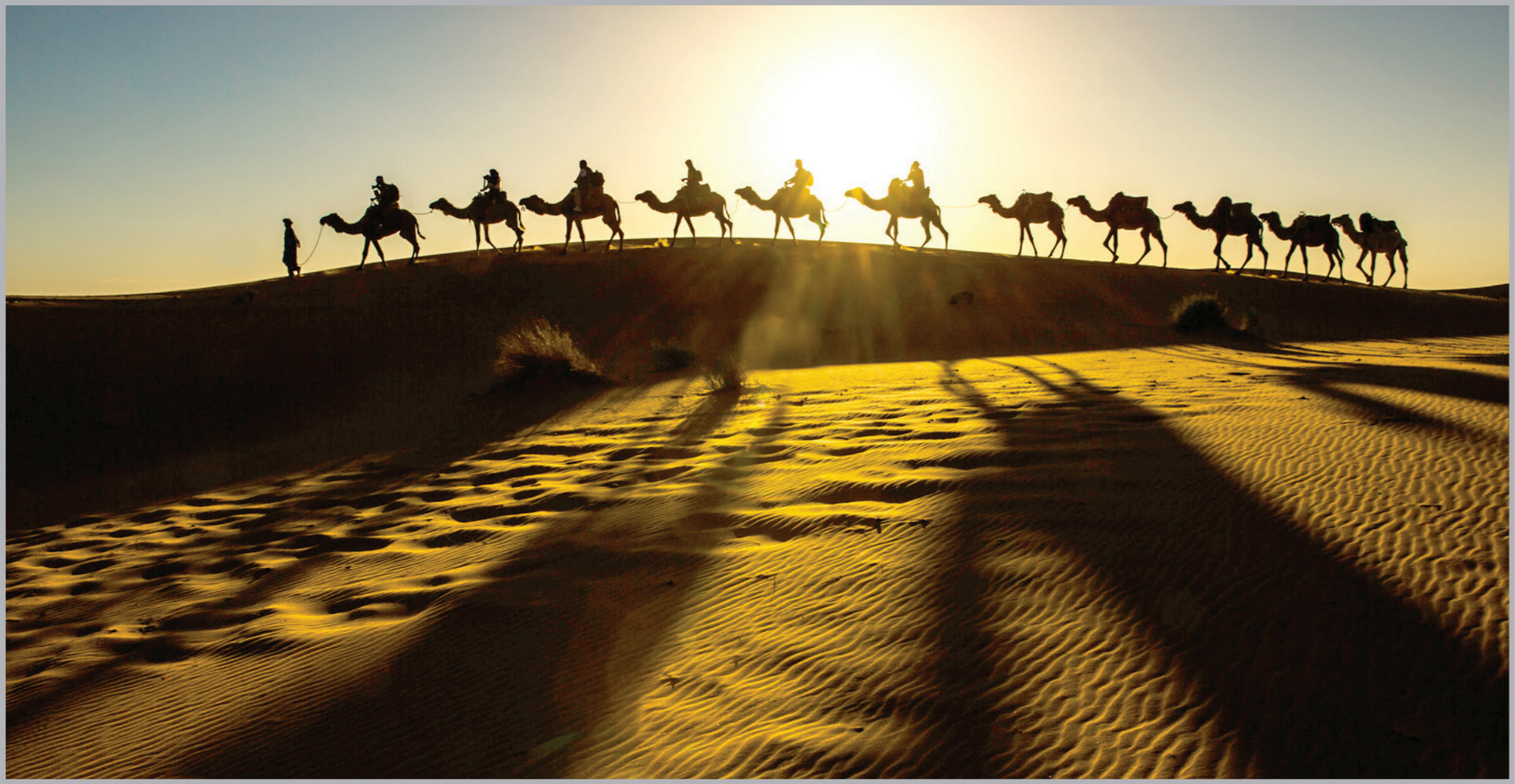
ازدهار التجارة مع بداية الإسلام