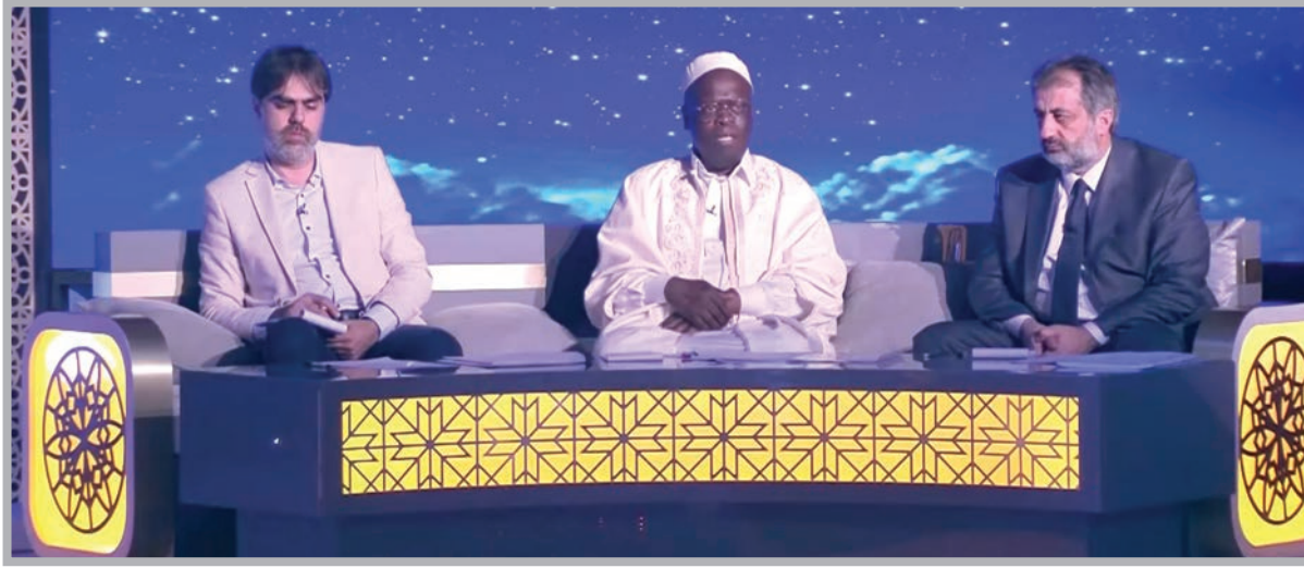
■ جانب من فعاليات المسابقة