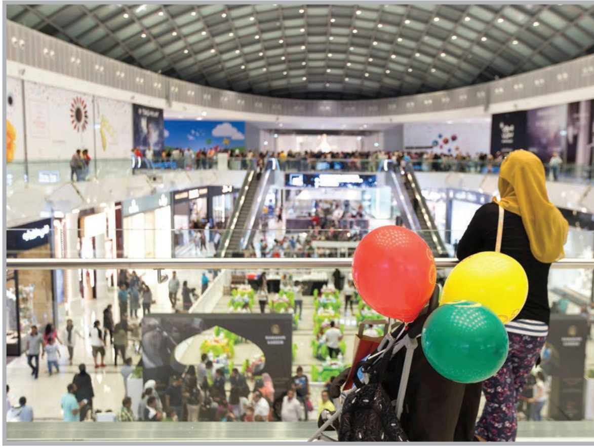
■ أنشطة وفعاليات لقضاء أجمل الأوقات بصحبة العائلة والأصدقاء في «دوحة فستيفال»

بين مطاعم ومقاهي، بدءاً بمطاعم 'ناندوز' و'تشيز كيك فاكتوري' و'بي اف تشانغز' و'تكساس رود هاوس' وصولاً إلى علامات أخرى تطلق للمرة الأولى في دولة قطر مثل 'جيميز إيتاليان' و'كافيه كوكو' و'800 ديجرينز' و'إيميز كافيه'. وباعتبارها الوجهة الترفيهية العالمية الأولى، تضم دوحة فستيفال سيتي العديد من خيارات الترفيه الداخلية والخارجية الفريدة في قطر، مثل أولى صالات 'فوكس سينماز' في قطر، والتي تضم 18 شاشة رقمية منها 4DX رباعية الأبعاد، ووصولاً إلى المساحات الخضراء المكشوفة للأنشطة مثل ركوب الدراجات والجري والمصممة ليستمتع بها الزوار من كافة الأعمار، كما تحتضن دوحة فستيفال سيتي 4 متنزهات ترفيهية تقدم تجارب فريدة من نوعها وحصرية في قطر وهي 'انجري بيردز وولد' و'سنو ديونز' و'جونيفرس' و'متنزه فيرثوسيتي'.