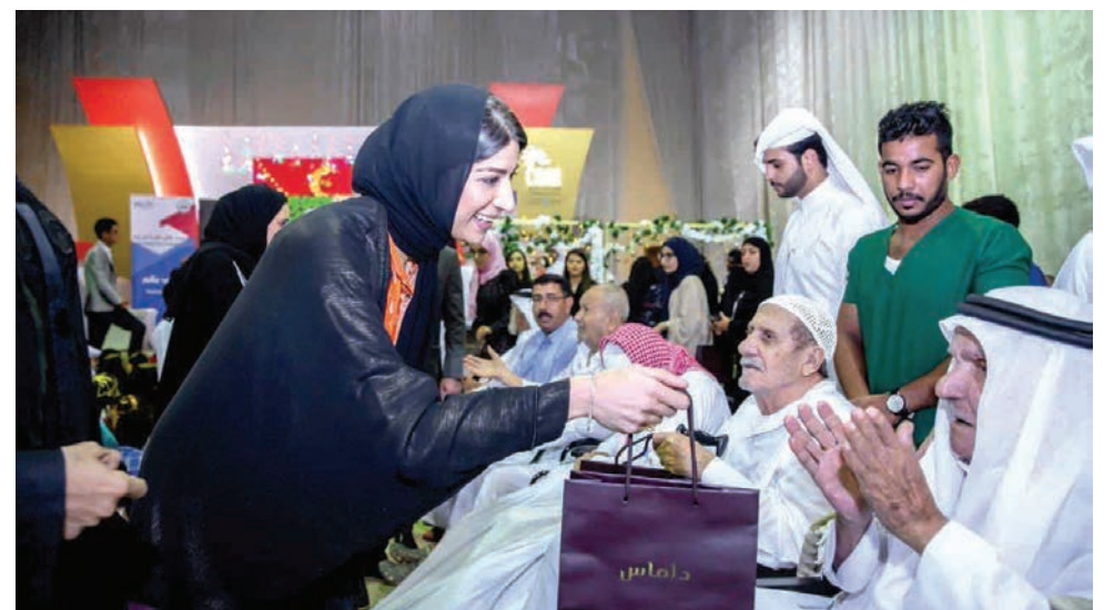
عائلة مؤسسة أسباير زون تتشارك الفرح بالشهر الكريم مع نزلاء إحسان