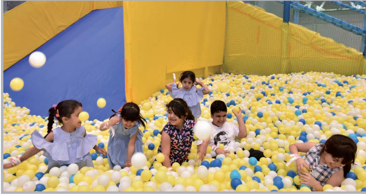
■ جانب من فعاليات مهرجان صيف 2017

تقدم مراكز التسوق الـ 11 المشاركة في المهرجان عروضاً ترويجية خاصة وخصومات تصل حتى 50%، وفي مقابل كل 200 ريال قطري يتم إنفاقها في أي من مراكز التسوق المشاركة في مهرجان صيف قطر، سيحق للمتسوقين دخول ثلاثة سحبيات تتاح لهم خلالها فرصة الفوز بإحدى الجوائز من بين 27 جائزة نقدية مقيمة تبلغ قيمتها الإجمالية مليوني ريال أو الفوز بسيارة لامبورجيني هوراكان (موديل 2018). خلال مدة مهرجان صيف قطر، تقدم نحو 50 فندقاً من فئة الـ 5 نجوم والـ 4 نجوم باقة العروض والتخفيضات على وجبة الضحى والدخول إلى الشاطئ وحمامات السباحة والإقامة والاستفادة من الخدمات التي تقدمها الأندية الصحية، وللتعرف على العروض التي يقدمها كل فندق، يمكن للراغبين زيارة الموقع الخاص بالمهرجان: qatarsummerfestival.qa