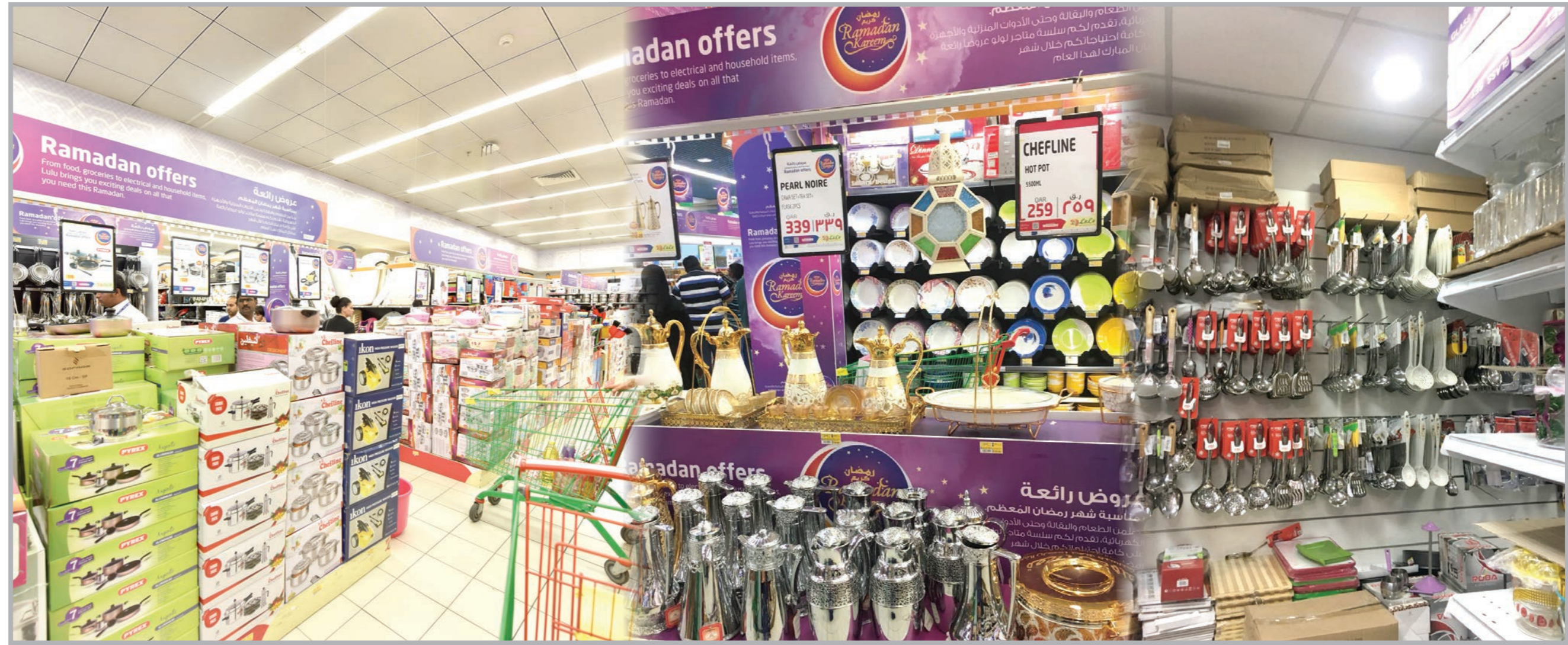
اعتادت الأسرة في رمضان تجديد الأواني المنزلية