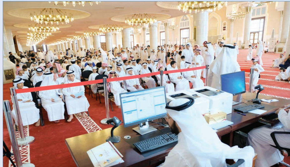
■ جانب من اختبارات البراعم العام الماضي (أرشيفية)

نعم.. فمع إدخال نظام إلكتروني عام للتسجيل في المسابقة، ونظام آخر خاص بالتحكيم في فرع البراعم، اهتمت المسابقة بتطوير كوادرها من المواطنين، وصقل مهاراتهم وتجاربهم، وتعزيز خبراتهم بإدارة المسابقات القرآنية ذات القاعدة العريضة من المشاركين، وكانت أولى الثمار تولي لجان تحكيم من الشباب القطري المؤهل والمدرب من داخل وزارة الأوقاف والشؤون الإسلامية، وخارجها، تقييم فرع البراعم في المسابقة.