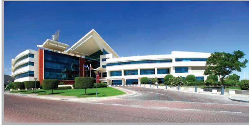
■ مستشفى جراحة العظام والطب الرياضي «سبيتار»