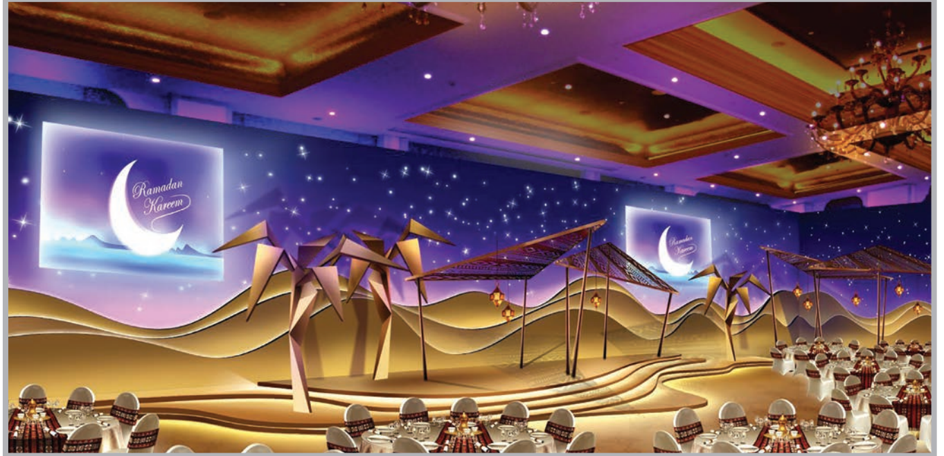
خيمة «صحارى الملكية»

وسعر بوفيه الإفطار هو 240 ريالاً للشخص الواحد و 290 ريالاً للشخص الواحد لبوفيه السحور، ويستمتع الأطفال تحت السادسة من العمر بالأكل مجاناً رفقة أهلهم، أما الأطفال الذي تتراوح أعمارهم ما بين السادسة والثانية عشر عاماً فيتم منحهم خصم 50%.