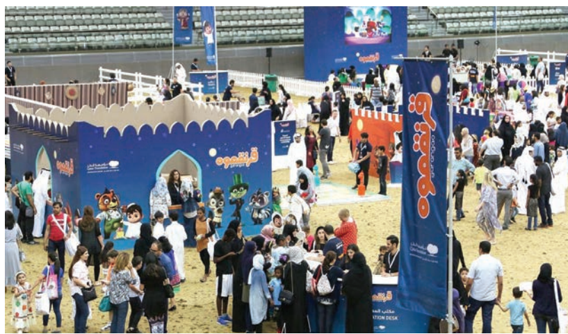
■ جانب من احتفالات القرنفوعة العام الماضي

وفي سياق الشهر الفضيل، سوف تحتفل مؤسسة قطر بالقرنفوعة يوم الجمعة الموافق 1 يونيو في الميدان الداخلي للشعب. ومن جهتها، تستضيف حديقة القرآن النباتية مسابقة الأترجة للطلاب الذين يقل عمرهم عن 12 عاماً. وتسعى هذه المسابقة، التي تُنظم بالتعاون مع جامع المدينة التعليمية، إلى تشجيع طلاب المرحلة الابتدائية على حفظ القرآن الكريم، فضلاً عن تعريفهم بأسماء النباتات والمصطلحات النباتية الواردة فيه. وبالإضافة إلى ذلك، يقدم جامع المدينة التعليمية إفتاراً يومياً على مدار الشهر المبارك لألف شخص، وأعضاء المجتمع مدعون للتطوع في سبيل عمل الخير، من خلال تعبئة هذه الوجبات وتوزيعها. وطوال شهر رمضان المبارك، سوف تستضيف مؤسسة قطر مجموعة من الفعاليات الرياضية.