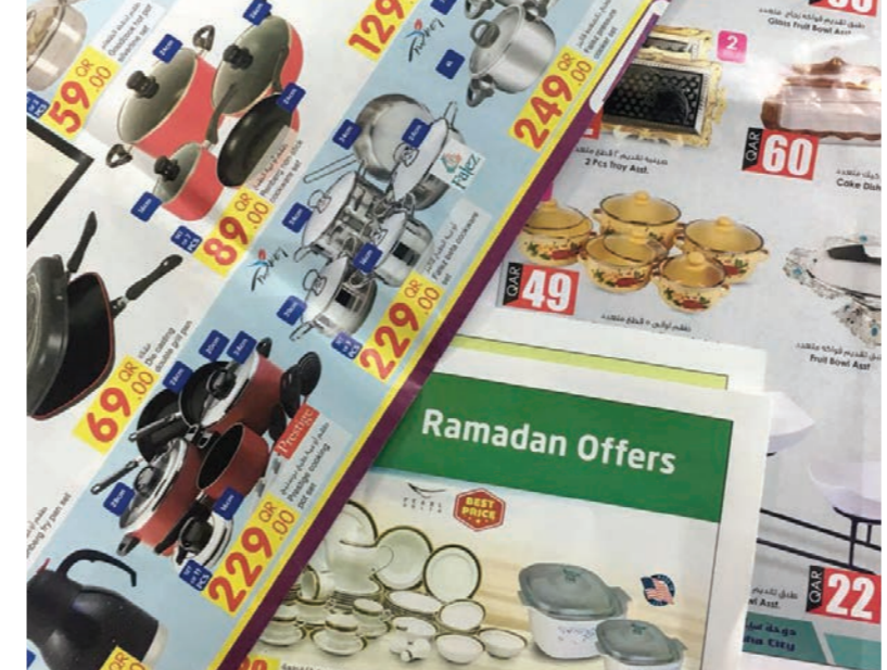
تزيينات على السلع الرمضانية

قطعة 29 ريالاً، عصارة يدوية 65 ريالاً، طقم مقالي 75 ريالاً، طقم أكواب مياه 6 قطع 25 ريالاً، طقم شوربه 16 قطعة 22 ريالاً، طقم تقديم فواكه 35 ريالاً، صينية صفاية قطعتين 62 ريالاً، ماكينة صنع المعكرونة 44 ريالاً، طقم تقديم السلطة قطعتين 22 ريالاً، رف تخزين خضروات 4 رفوف 65 ريالاً، طقم أواني ماركه تيغال 7 قطع 149 ريالاً.