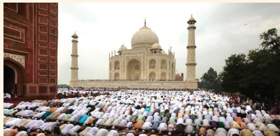
صلاة التراويح في الهند

د هل توجد أنشطة دبلوماسية تقوم به أو تشارك بها في شهر رمضان؟