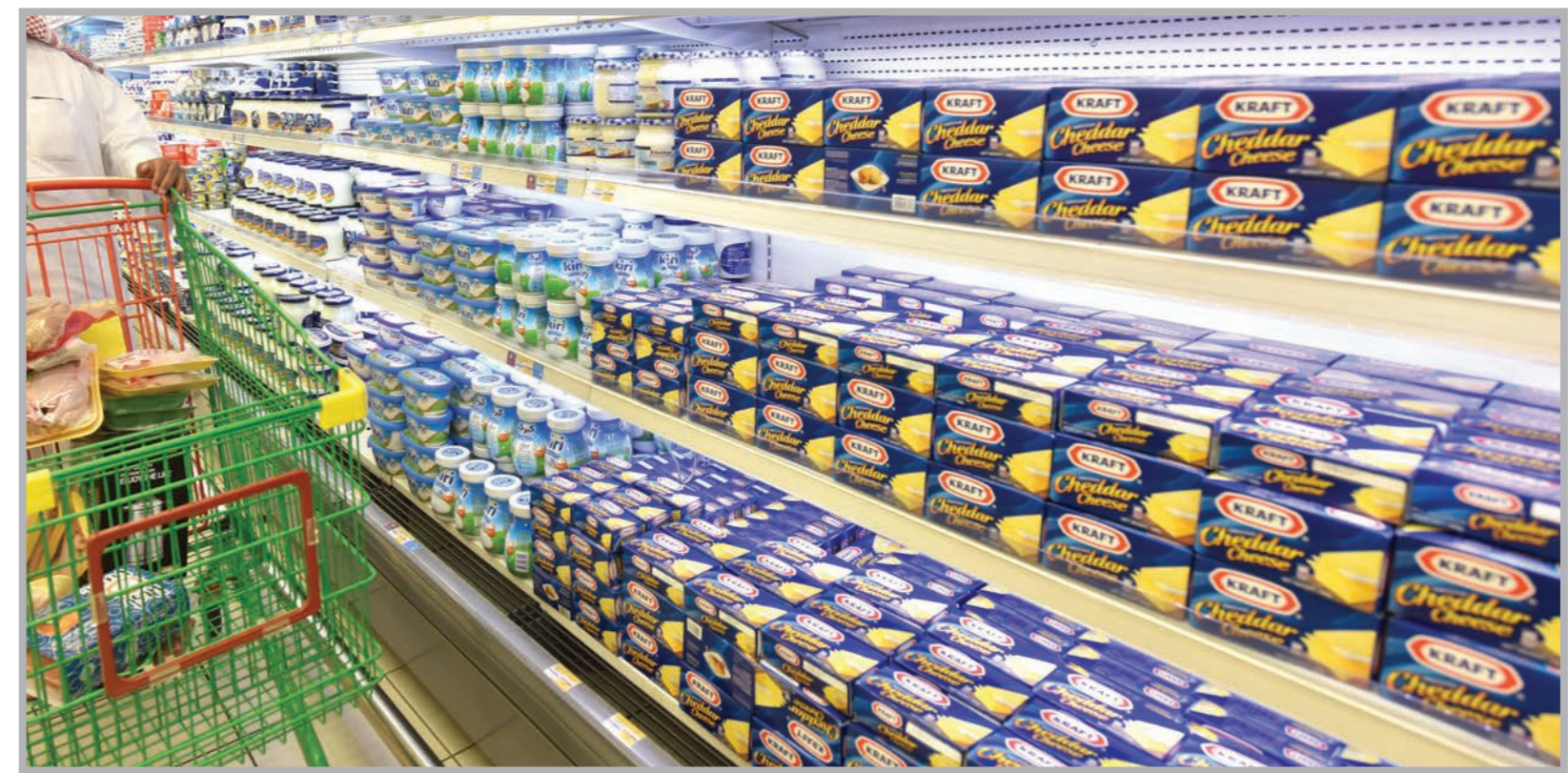
الأجبان والألبان شهدت حركة مبيعات متزايدة

الفضليل وذلك لوجود كميات كبيرة تغطي حاجة السوق المحلي. وأشار إلى أن الطلب على المواد الغذائية ومن اللحوم والدواجن والخضار والفواكه الطازجة بضعف قبل شهر رمضان المبارك وفي الأيام الأولى من الشهر، إلا أنه يبدأ بالتراجع التدريجي كلما اقتربت نهاية الشهر المبارك، مبينا أن الطلب يتحول في الأسبوعين الأخيرين على مستلزمات العيد من الحلويات والألبسة.