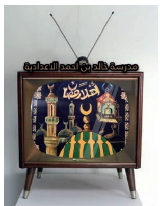
عمل لطلاب مدرسة خالد بن أحمد الإعدادية

(بنين - بنات) كما تبادلت الوزارة التهنئة بالشهر الفضيل مستخدمين بطاقات تهنئة تضمنت رسومات أعمال فنية لطلابها ضمن إنتاج مادة الفنون البصرية.