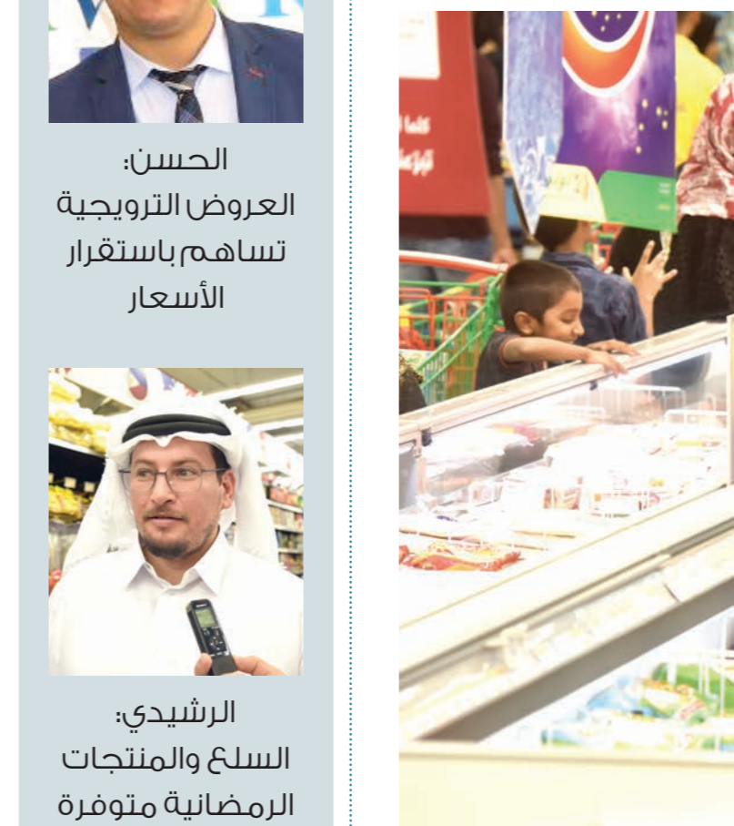
وفرة كبيرة في الأسواق المحلية

وأكد أن هناك تواصل مستمر ما بين المجمعات التجارية الكبرى التي تباع المواد الغذائية يساهم، إلى حد كبير، في استقرار الأسعار المحلية، بالإضافة إلى أن دور وزارة الاقتصاد والتجارة في دعم السلع الأساسية وتحديد أسعارها، يحدث حالة من الاستقرار السعري في الأسواق المحلية.