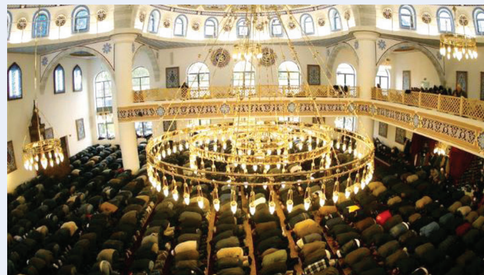
■ صلاة التراويح في أحد مساجد بلجيكا... أرشييفية

D ما العادات والطقوس القطرية التي تفتقدتها في بلجيكا؟