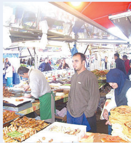
■ نهار صوم طويل في رمضان ببروكسل