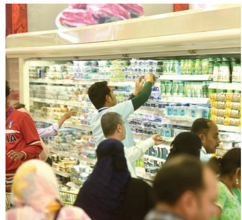
الحليب ومشققاته أكثر السلع مبيعا مع حلول رمضان