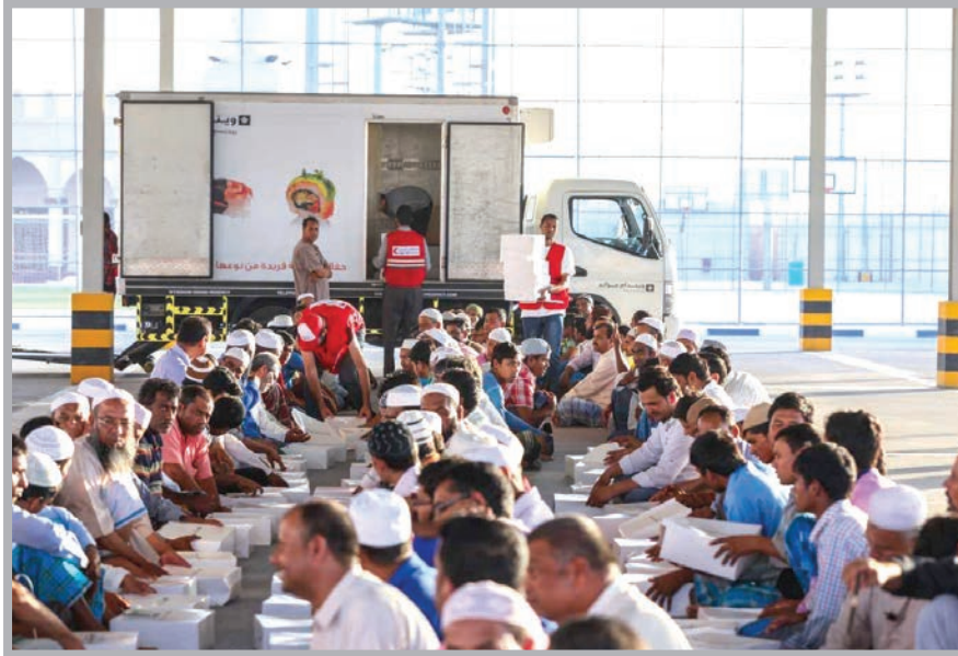
يتم توزيع وجبات إفطار للعمال على مدار شهر رمضان