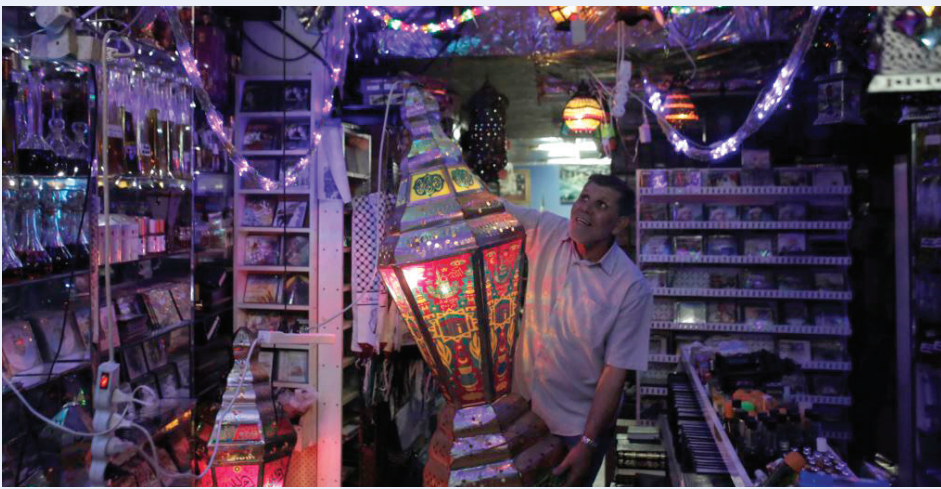
■ مسلمو بلجيكا يحتفلون بالشهر الفضيل

قال سعادة عبدالرحمن بن محمد الخليفي، سفير قطر لدى مملكة بلجيكا، إن رمضان في الدوحة له طعم خاص وهو جزء مهم من هويتنا التي لا نستغني عنها. وأضاف الخليفي في حوار مع «مضانيات» أن عمله في السلك الدبلوماسي جعله نادراً ما يقضي رمضان في الدوحة، وبالتالي يحاول قدر الامكان أن تكون اجواء البيت في رمضان أشبه بالدوحة، بحيث تجتمع الأسرة كلها على مائدة الإفطار وتحرس العائلة على المحافظة على العادات القطرية خلال هذا الشهر الفضيل. وقال السفير إن السفراء العرب والمسلمين المعتمدين في بلجيكا ينظمون موائد إفطار وأمسيات خلال رمضان ويحرص على المشاركة فيها كلما ساحت الفرصة لأن هذه المناسبات فرصة للتعرف على الدبلوماسيين وربط العلاقات الوثيقة معهم خارج الإطار الرسمي للاجتماعات والمؤتمرات... وإلى نص الحوار: